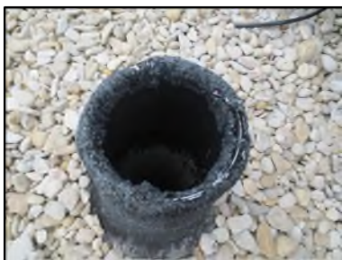
Photo N° 346 AMIANTE CIMENT -- TOITURE TERRASSE Toiture Ventilation haute (Fibres-ciment)

Dossier n°: 2013-09-300 FK DTA PC-21LAB-OPH